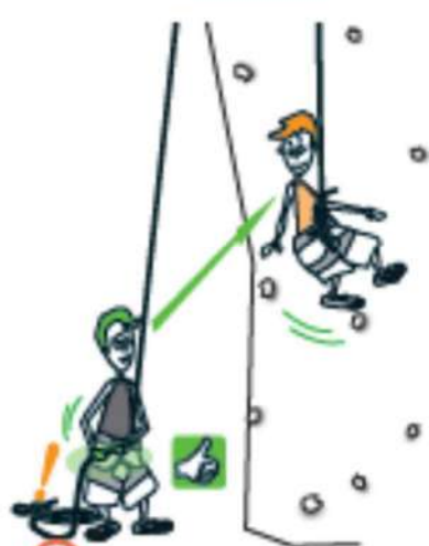
5 MAÎTRISEZ LA VITESSE !