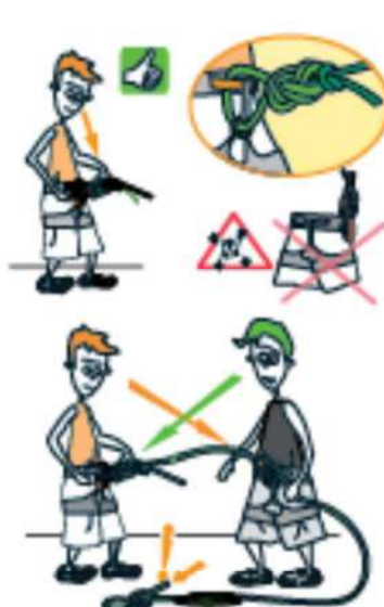
1 VÉRIFIEZ LES POINTS CLÉ !