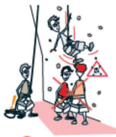
7 ÉCARTEZ-VOUS !