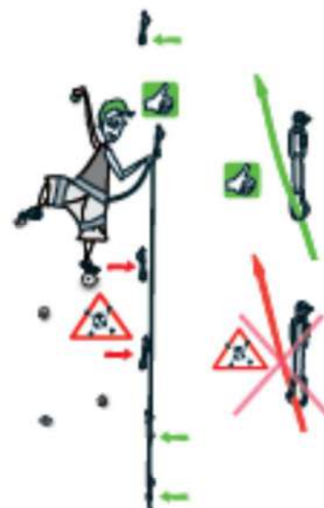
2 MOUSQUETONNEZ !