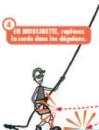
4 EN MOULINETTE, repliez le corde dans les doigts.