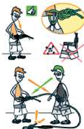
1 VÉRIFIEZ LES POINTS CLÉS !