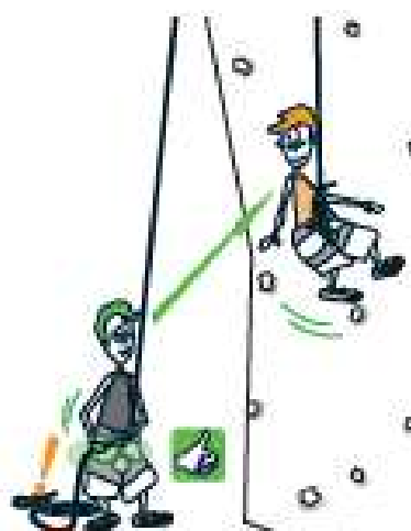
5 MAÎTRISEZ LA VITESSE !