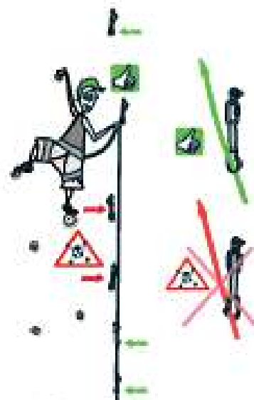
2 MOUSQUETONNEZ !