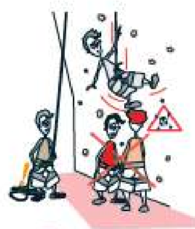
7 ÉCARTEZ-VOUS !