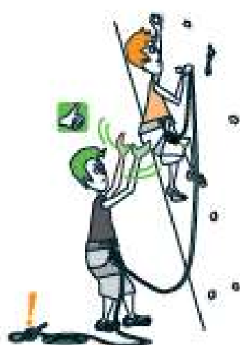
3 PAREZ !